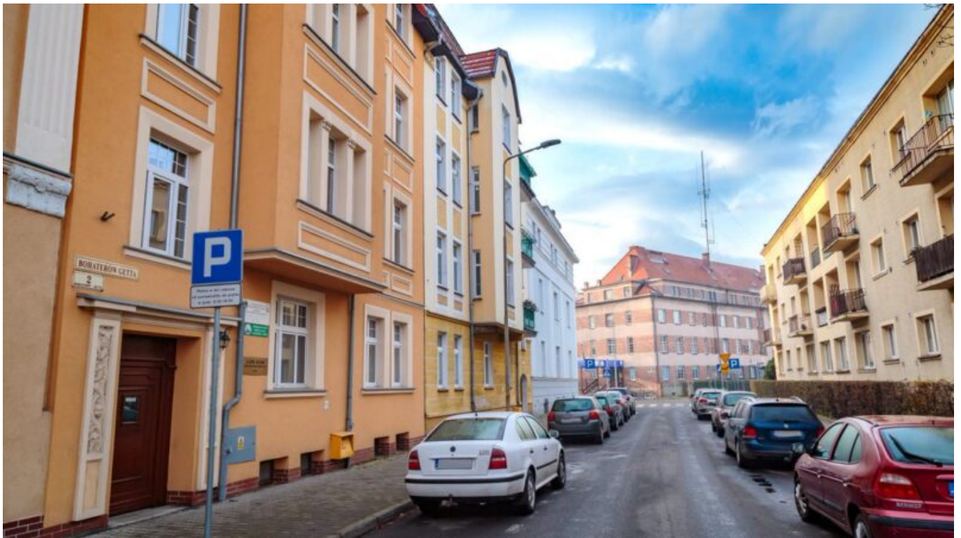
Ulica Bohaterów Getta w Jeleniej Górze

Na Dolnym Śląsku ulice i place poświęcone bohaterom getta warszawskiego można odnaleźć w ponad 20 dolnośląskich miastach – w Bielawie, Bolesławcu, Chojnowie, Dusznikach-Zdroju, Dzierżoniowie, Głuszycy, Jaworze, Jedlinie-Zdroju, Jeleniej Górze, Kamiennej Górze, Kłodzku, Legnicy, Nowej Rudzie, Piławie Górnej, Strzegomiu, Świdnicy, Wałbrzychu, Wrocławiu, Ząbkowicach Śląskich, Zgorzelcu, Ziębicach i Złotorzy.