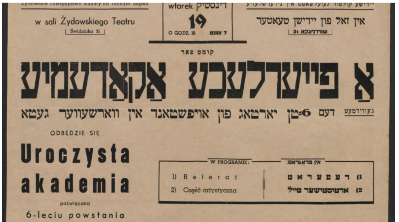
Obchody wybuchu powstania w getcie warszawskim w latach 40.