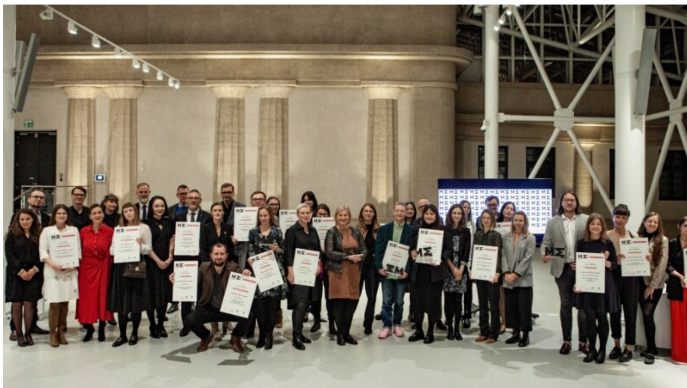
Reprezentanci instytucji nagrodzonych podczas 5. Przeglądu Muzeum Widzialne 2022 (NIMOZ)

Koncepcja identyfikacji wizualnej Muzeum Getta Warszawskiego została wyłoniona w międzynarodowym konkursie przeprowadzonym wspólnie ze Stowarzyszeniem Twórców Grafiki Użytkowej. Konkurs został ogłoszony we wrześniu 2019 r. W pierwszym etapie wpłynęło 216 zgłoszeń, spośród których jury wybrało sześć. Autorami zwycięskiej koncepcji – przekładającej misję Muzeum Getta Warszawskiego z oficjalnego języka na przekaz emocji odwołujący się do indywidualnej pamięci – zostali projektanci z litewskiego studia DADADA .