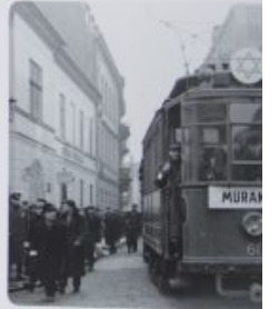
Wóz tramwajowy przy ul. Dzielna, kierunek: Stacja A tram at the end of Dzielna Street, direction: Stacja