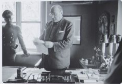
Prezes Rady Żydowskiej w getcie warszawskim, Adam Czerniakow The Chairman of the Jewish Council in the Warsaw ghetto, Adam Czerniakow