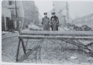
Czekoladownia Żydowska; Składowa Przemysłowa, ul. Słomska przy ul. Miodowej Chocolate factory; Warehouse, Słomska St., near Miodowa St.