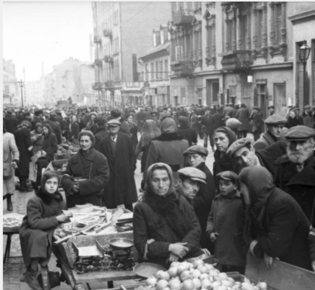
F-0782-24 i 1941 ca.

Oblicza się, że w latach 1940 – 1942 zmarło w getcie ok. 100 tysięcy osób.