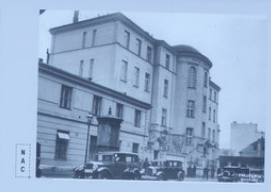
WITNESS OF HISTORY: THE BERSERON AND BAUMAN HOSPITAL IN WARSAW

The building at 51 Siłka Street / 60 Sienka street was built as the Berseron and Bauman Children's Hospital in 1876-1878 with the donations and bequest of two affluent families that became the facility's patrons, initially offering just twenty four beds for patients, over the years many eminent doctors worked at the hospital, such as Henryk Guldzinski (Janusz Korczak), who practiced there in 1905-1912.