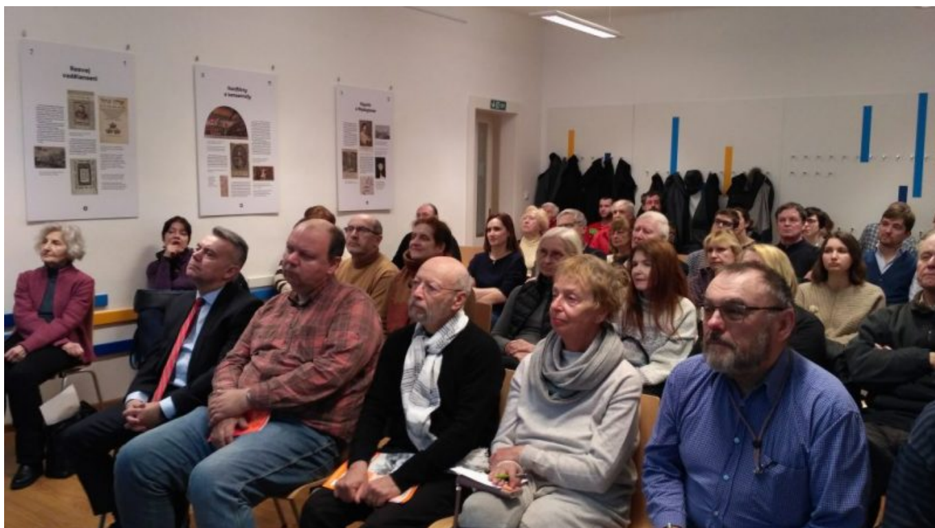
W Pradze o społecznościach żydowskich w Rzeczypospolitej Obojga Narodów